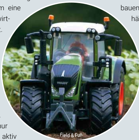
Field & Fun

Auf dem Gelände des Guts Sierhagen erwartet dich auf 400qm eine außergewöhnliche landwirtschaftliche Miniaturwelt. Hier wird alles naturgetreu und mit viel Liebe zum Detail im Kleinformat präsentiert: Vom Wirtschaftshof über Getreidefelder bis hin zu den unterschiedlichsten Nutztierweiden. Dabei kann man nicht nur schauen, sondern selbst aktiv