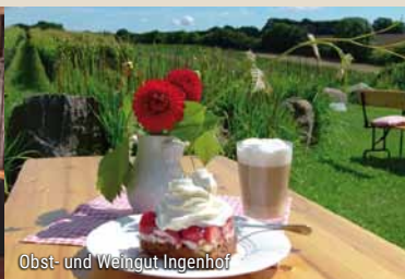
Obst- und Weingut Ingenhof