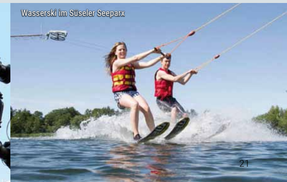
Wasserski im Süseler Seeparx