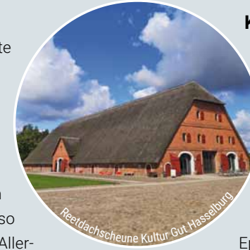
Reetdachscheune Kultur Gut Hasselburg