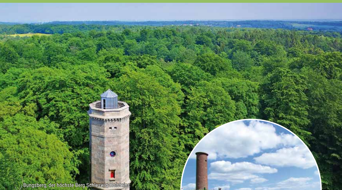
Bungsberg, der höchste Berg Schleswig-Holsteins