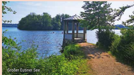
Großer Eutiner See

Plane unbedingt einen Besuch in der Kunsthalle St. Annen ein. Bis Oktober kannst du hier die Werke des bekannten Schauspielers und Malers Armin Müller-Stahl bestaunen.