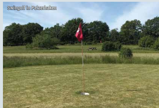
Swingolf in Pelzerhaken

• Pelzerhakener Straße 65 23730 Neustadt in Holstein