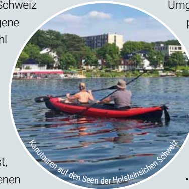
Kanutouren auf den Seen der Holsteinischen Schweiz

Entdecke die Holsteinische Schweiz von den Seen aus auf eigene Faust mit einem Kanu. Sowohl in Plön, als auch in Malente kannst du dir ein Kanu ausleihen und eine Fahrt über die wunderschönen Seen der Holsteinischen Schweiz unternehmen. Wenn du dein eigenes Kanu dabei hast, kannst du es an verschiedenen Einlasspunkten zu Wasser lassen.