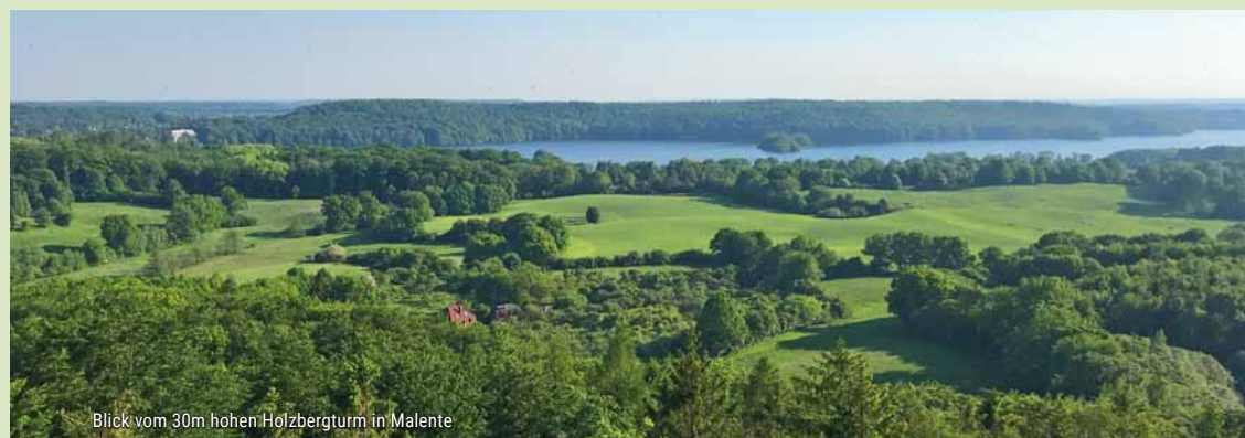
Blick vom 30m hohen Holzbergturm in Malente

kannst du von einer Aussichtsplattform, die sich 90m über dem Meeresspiegel befindet, einen grandiosen Blick über Malente, die umliegenden Orte und Seen der Holsteinischen Schweiz genießen.