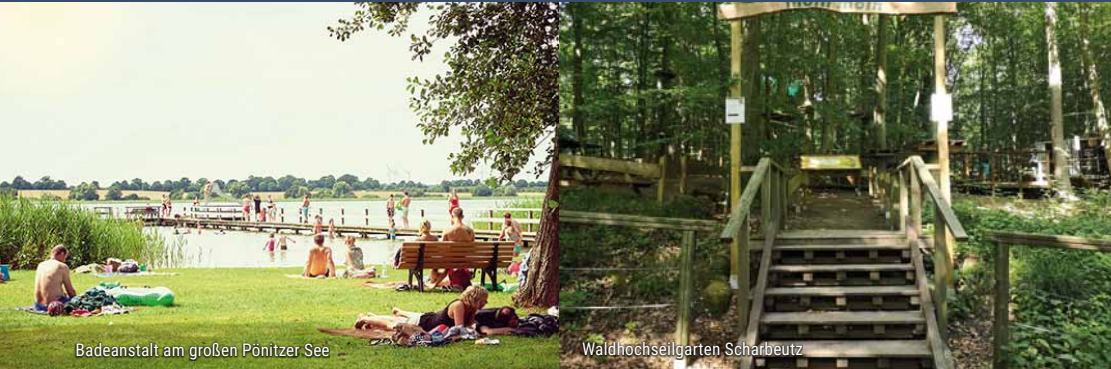
Badeanstalt am großen Pönitzer See