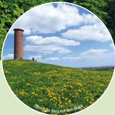
Gömnitzer Berg mit dem Major