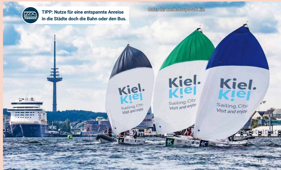
Hafen der Landeshauptstadt Kiel

TIPP: Nutze für eine entspannte Anreise in die Städte doch die Bahn oder den Bus.