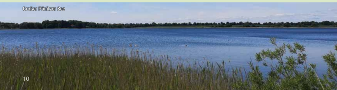
Großer Pönitzer See