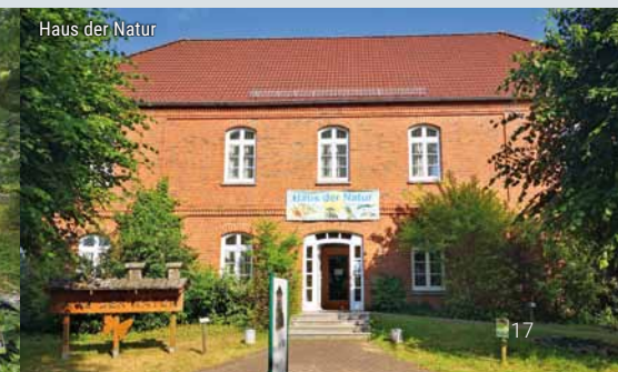
Haus der Natur