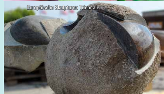
Europäische Skulpturen Triennale