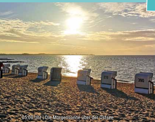
05:00 Uhr | Die Morgensonne über der Ostsee

DER PERFEKTE TAG oder: Eine kleine Anleitung zum Glückhsein