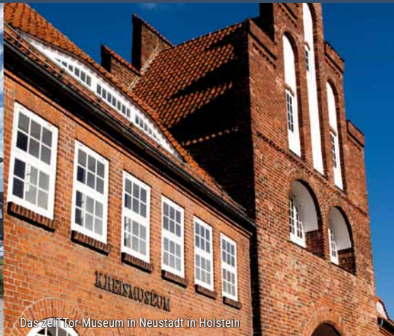
Das zeiTTor-Museum in Neustadt in Holstein