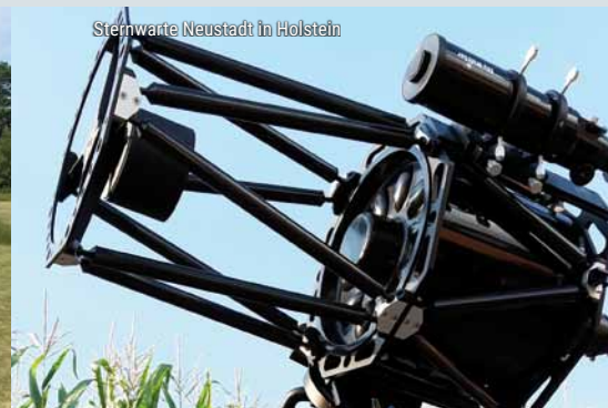
Sternwarte Neustadt in Holstein