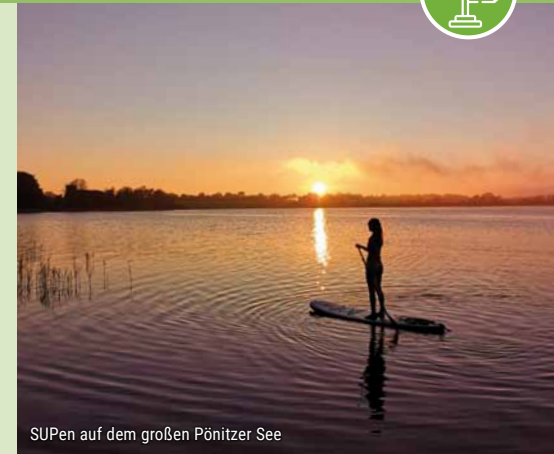
SUPen auf dem großen Pönitzer See

Im idyllischen Ort Gleschendorf, dessen Zentrum die Feldsteinkirche bildet, befindet sich das Pastoratsgehölz. Hier haben sich vor einigen Jahren Seeadler niedergelassen. Zudem wird das Waldgebiet von der Schwartau durchflossen. Auf 800m klärt ein Gewässerlehrpfad an acht Stationen über den Einfluss der Eiszeit sowie die Funktion von Wassermühlen auf und an Pumpstationen kannst du selbst aktiv werden.