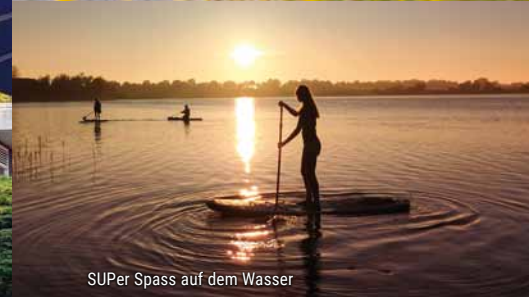
SUPer Spass auf dem Wasser