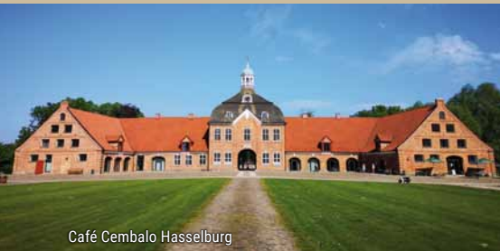
Café Cembalo Hasselburg