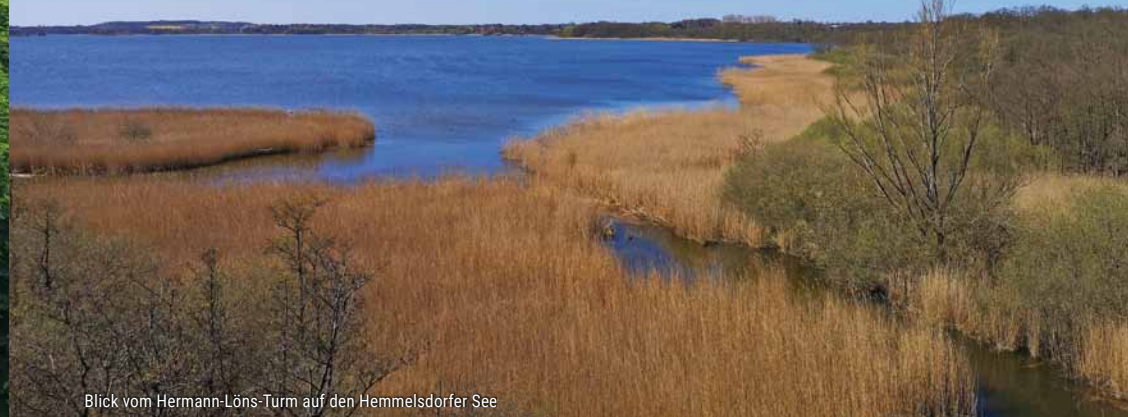
Blick vom Hermann-Löns-Turm auf den Hemmeldorfer See

Superlativ, aber super schön – ist unberührte Landschaft des Naturschutzgebietes Aalbeek-Niederung. Die Tierwelt rund um die Niederung am Hemmeldorfer See genießt du am besten vom 12m hohen Hermann-Löns-Turm. An klaren Tagen kannst du sogar die sieben Türme Lübecks erkennen.