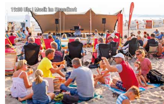
19:00 Uhr | Musik im Strandkorb