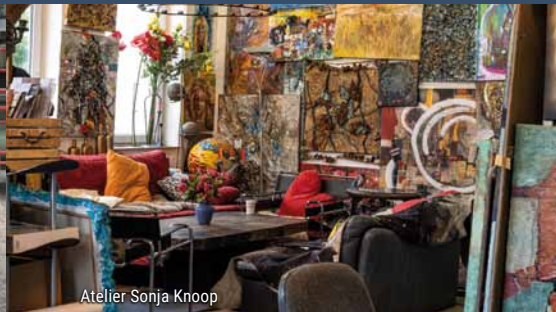
Atelier Sonja Knoop