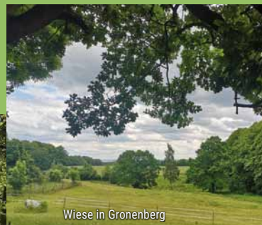
Wiese in Gronenberg