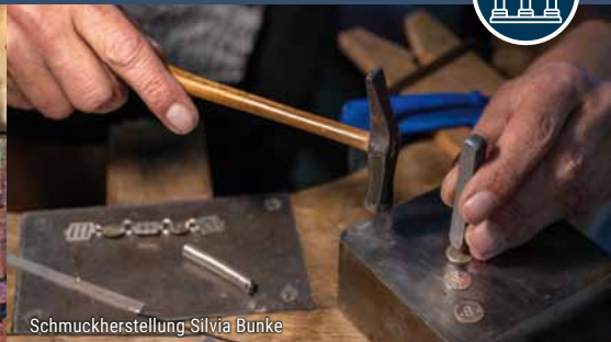
Schmuckherstellung Silvia Bunke