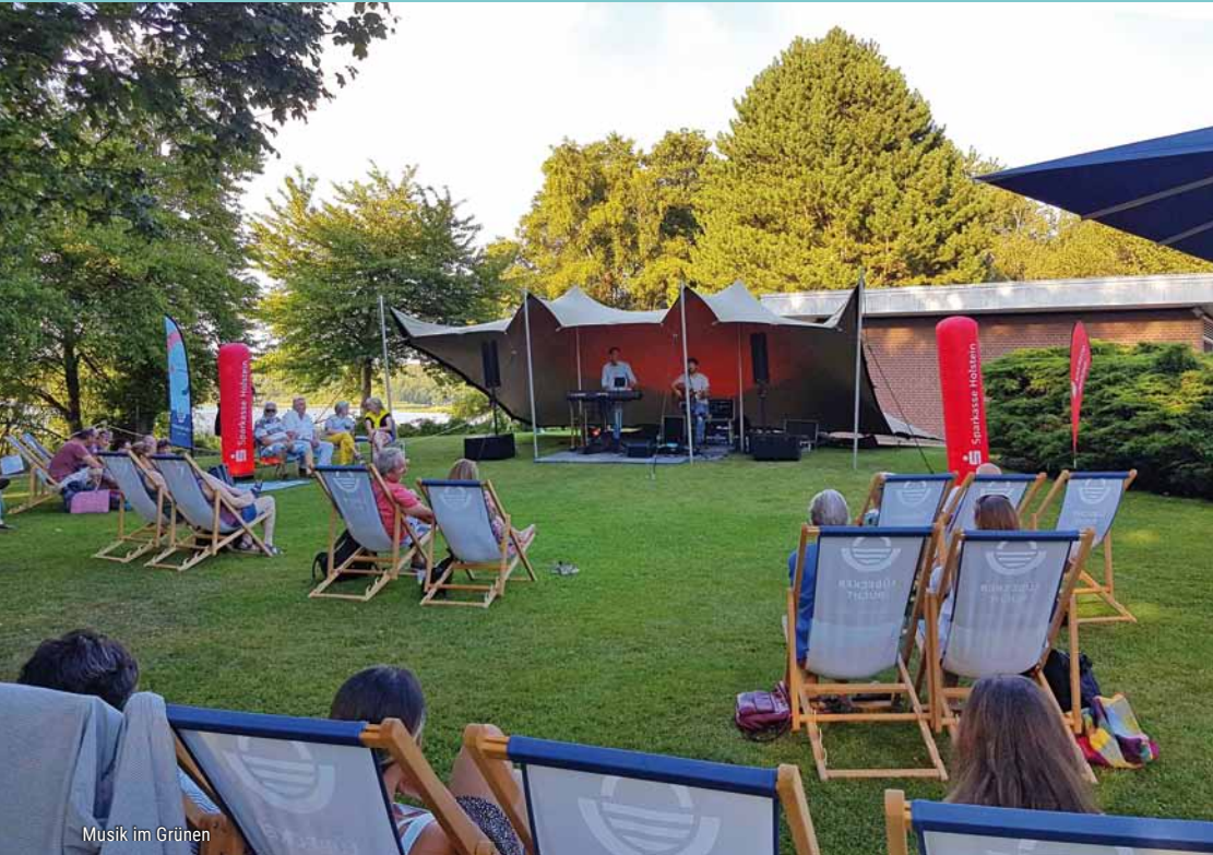
Musik im Grünen

Zur Krönung deines Tages im Grünen suchst du nach besonderen Events und Erlebnissen? Sehr gut! Im Binnenland der Lübecker Bucht erfährst du aktive Entspannung am Wasser, relaxende Atmosphäre im Wald oder Musik- und Kulturerlebnisse in schönster Kulisse.