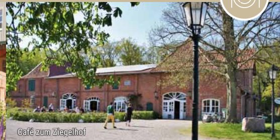
Café zum Ziegelhof