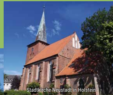
Stadtkirche Neustadt in Holstein

Tauche ein in die Geschichte der Lübecker Bucht. Das Highlight dieser Radtour ist das Kloster Cismar, eine ehemalige Benediktinerabtei. In Cismar befindet sich zudem auch das Haus der Natur, ein liebevolles Naturkundemuseum, das