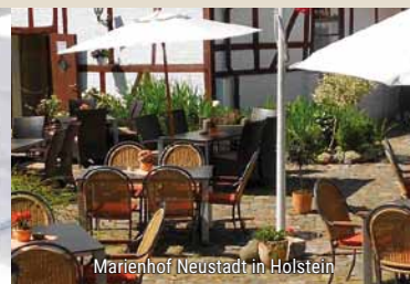
Marienhof Neustadt in Holstein