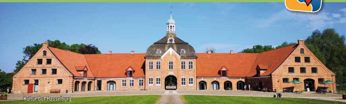
Kultur Gut Hasselburg